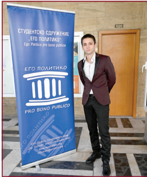
Представител на клуба „Его политико“.

„Еко клуб“ е студентска общност, която се фокусира върху значими теми от съвременното глобализирано общество: устойчиво развитие, замърсяване на околната среда, зелено предприемачество, кръгова икономика. Организиран се дискусии и събития, провеждат се доброволчески инициативи и акции, а в свободното си време клубът участва в състезания и преходи в планината. Може да откриете страницата на общността и в социалните мрежи. Членовете не се придържат към общоприетите норми. Те винаги работят в екип. Някои от инициативите им включват гаряването на капачки, озеленяването на дворните пространства в университета и предлагането на идеи за по-добро развитие на екологични проблеми.