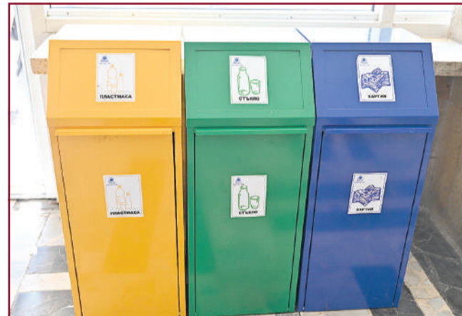
Разделно събиране за по-зелена планета.

Същото важи и за зарядните станции, чрез които можете да заредите телефон, таблет или лаптоп. Това е добра възможност за повечето студенти, тъй като много често се случва да забравяме зарядните си вкъщи. Ако разчитате на лаптопа или таблета си, за да бъдете отличници в университета, УНСС мисли точно за вас, защото такива станции можете да откриете във фоайетата на корпусите „А“, „В“, „Г“, „И“, както и на най-новия „К“ корпус. Инсталирани са общо 5 енергоспестяващи зарядни станции за телефони, планшети и лаптопи, всяка от които е оборудвана с LED осветление. Тези станции са на разположение на всички студенти, преподаватели и служители на уни-