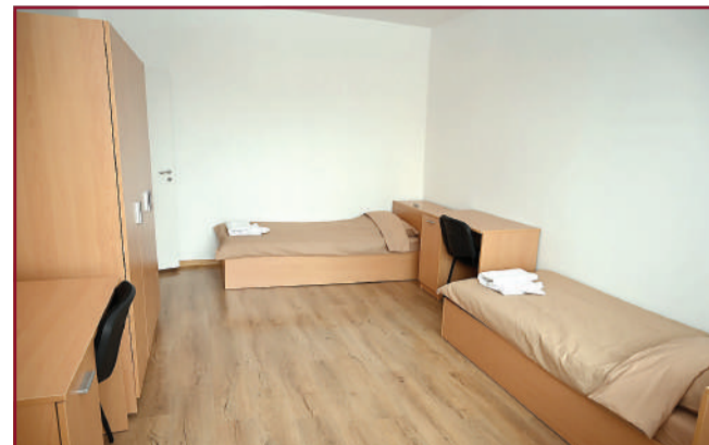
Тук се споделят смехът и тъгата, ученето и преживяванията.