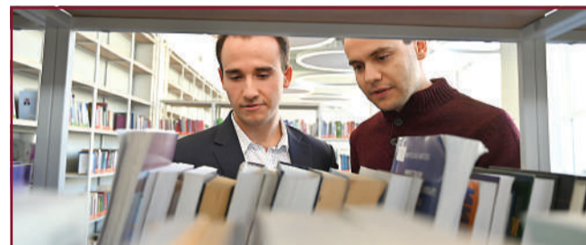
Изцяло нови рафтове с многобройни книги, които студентите могат да заемат.

На 14 ноември 2023 г. бе официалното откриване на реновираната библиотека, на което присъстваше министър-председателят на Република България акад. Николай Денков. „Всички виждаме, че усилията са си стрували. Радвам се, че един от приоритетите ви е бил именно модернизиранието на библиотеката.