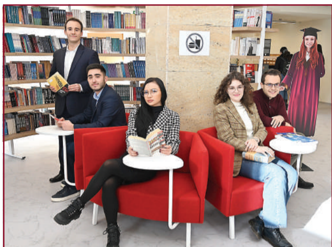
Модернизираната библиотека ви очаква!

С развитието на информационните и комуникационните технологии всички библиотеки са изправени пред нови предизвикателства. За да запазят силната си роля в обществото и най-вече в академичните среди, те започват да внедряват иновациите и в своята дейност.