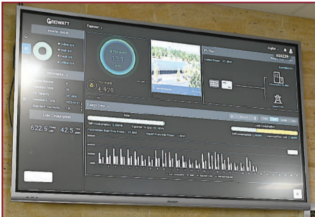
Мониторите, които са част от системата „Умен дом“, отчитат в реално време спестената енергия.

Друго, което ще откриете при нас, са зарядни станции за електрически автомобили, както и зарядни станции за телефони, планшети и лаптопи. От сеп-