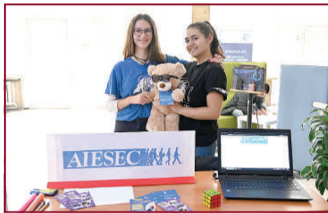
Клуб АIESEC ви очаква!