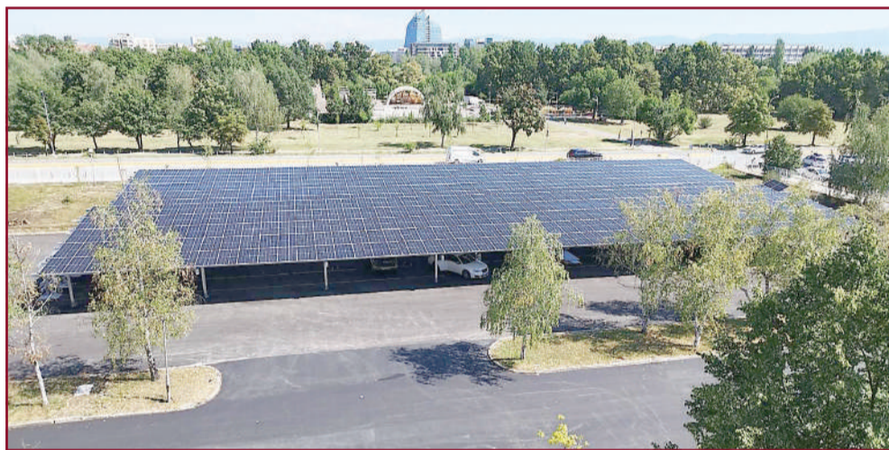
Университетът разполага с два фотоволтаични парка, изградени върху покрива и върху новоизградения паркинг.

Нашият университет е „зелен“ не само защото има много пространства, съобразени с околната среда. Но и защото все повече внедрява и използва енергийно ефективни практики, съобразени с минималното замърсяване на природата.