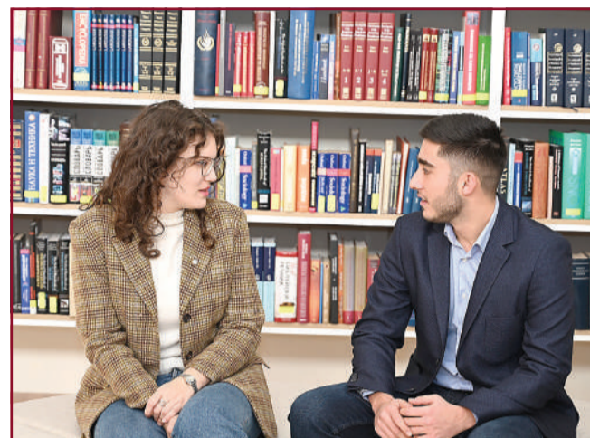
В спора се ражда истината.

Нашата библиотека не отстъпва от новите тенденции – даже тя е от първите в своето направление, започнали да дигитализират книжовното си наследство. Библиотеката на УНСС е създадена през 1923 г. и през годините преминава през много трансформации. Още през 2012 г. са купени Book скенер и автоматична машина за почистване на книги. Създадена е и дигитална библиотека. От скорошните нововъведения е станцията за самообслужване Bibliotheca selfCheck, която улеснява заемането и връщането на учебници и книги бързо и лесно. От 2022 г. вече читателските карти са обвързани със студентските книжки и е въведена система за електронен подпис.