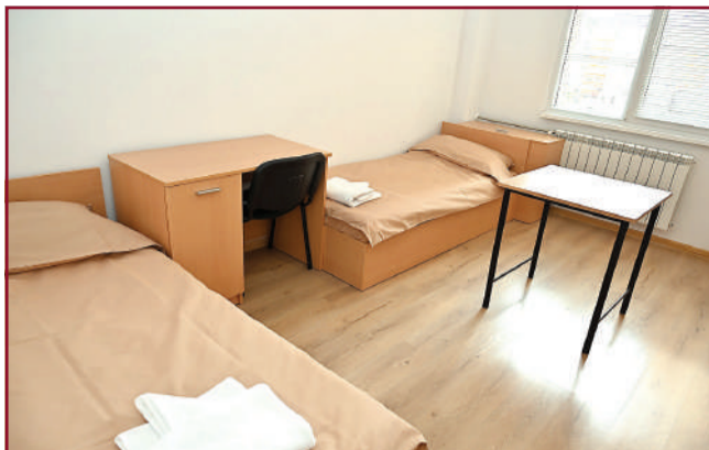
Стаите са оборудвани с нови мебели – легла, бюра, гардероби.