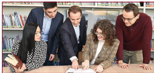
Обновените читални предоставят по-добра база за учене.

През 2023 г. се навършиха 100 години от създаването на библиотеката на нашия университет. За този рожден ден бе направен най-големият подарък за нея и за студентите – библиотеката бе реновирана. Министерският съвет чрез Министерството на финансите и Министерството на образованието предостави близо 2 милиона лева за ремонт и модернизация. На разположение на читателите вече има зали, места за експнни дейности и LibraryHub – споделено пространство за неформални срещи на студенти и преподаватели.