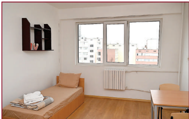
Блоковете на университета са реновирани и модернизирани.