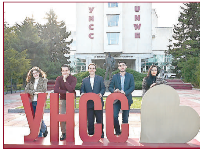
Добре дошли в нашия университет.

култета: Общикономически, Финансово-счетоводен, Управление и администрация, Икономика на инфраструктурата, Международна икономика и политика, Приложна информатика и статистика, Бизнес факултет и Юридически факултет; 36 катедри; 4 института; 32 научноизследователски центъра и др.