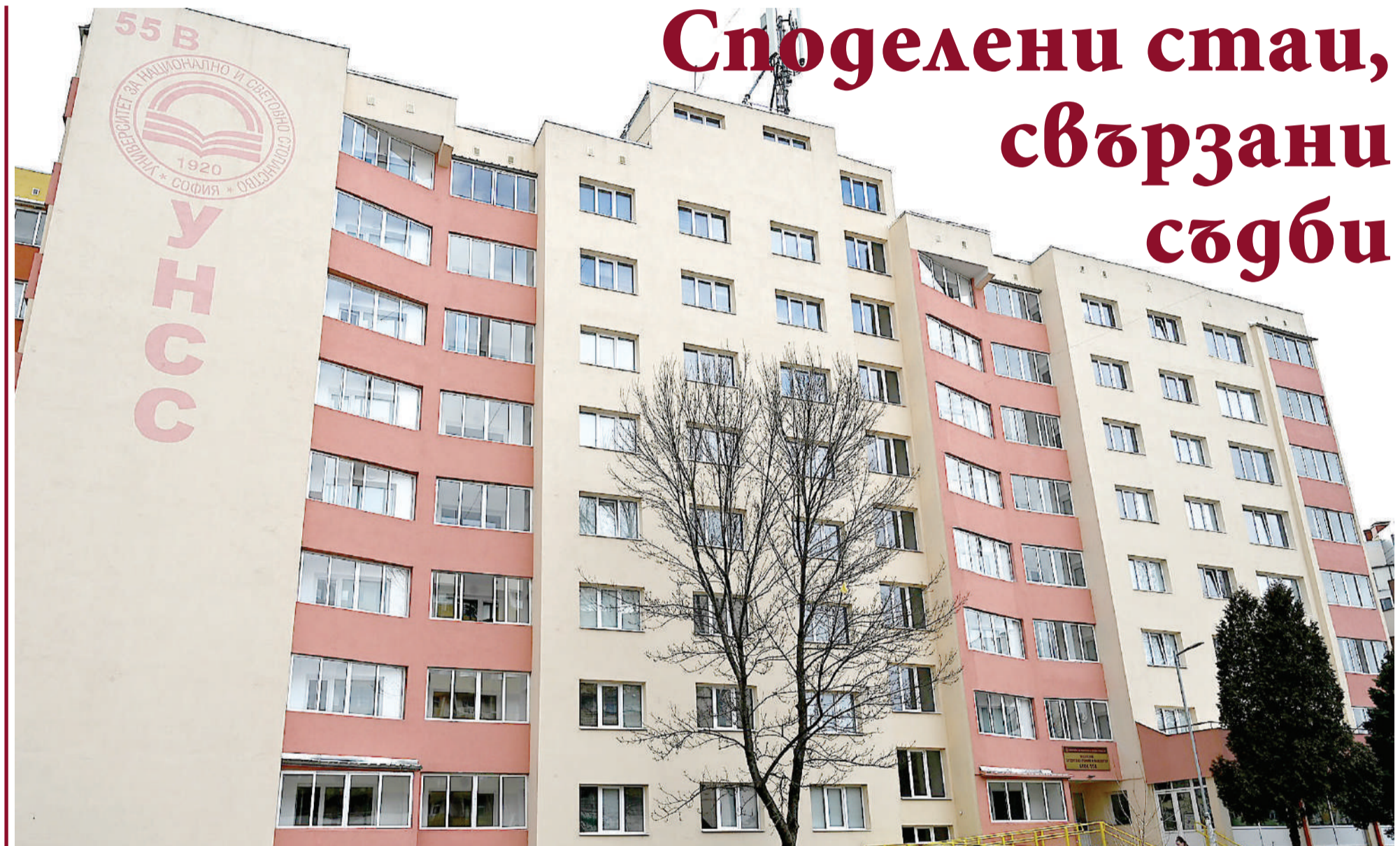
Добре дошли в студентската крепост!

Общежитията са известни още като крепостта на студентите. В тях се разиграва невероятна сага, която би могла да се конкурира с историите за Хари Потър. Тук, сред книги, лаптопи и огромни купища с учебници, се развиват всякакви случки.