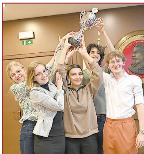
Пътят към успеха минава през УНСС.

В УНСС дигитализацията е развита на високо ниво. Студентската книжка е директно в телефона на студентите, а електронните услуги, които предлага университетът, спестяват опашките по гишетата и струпването на студентите. В системата Уеб Студент се предлагат над 21 онлайн услуги, които улесняват процесите по кандидатстване и записване.