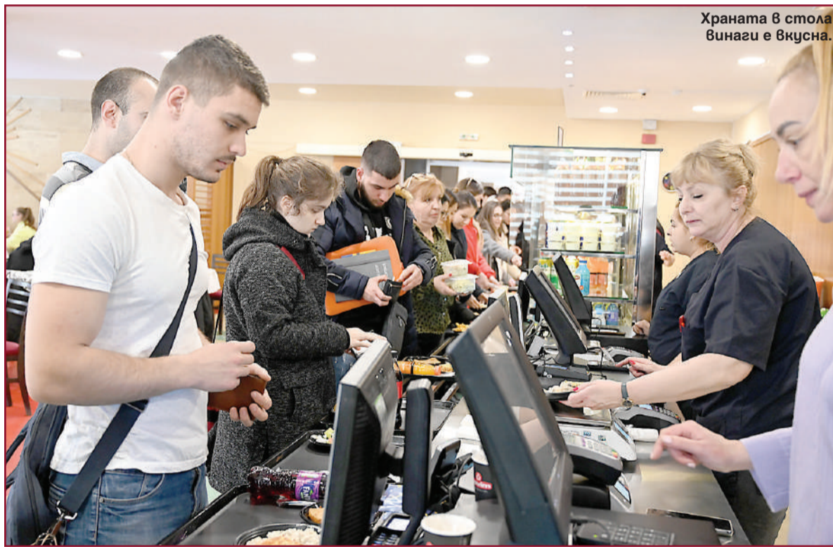
Храната в стола винаги е вкусна.